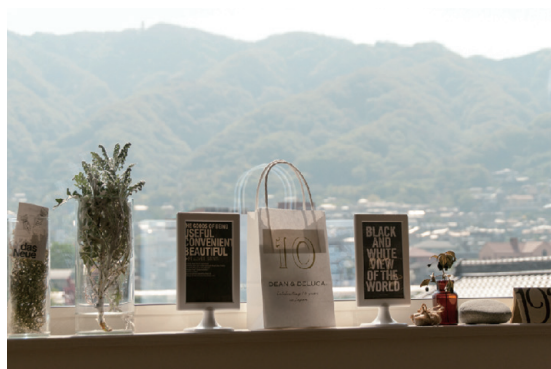
おしゃれな雑貨の先に見える、美しい信貴の山並み