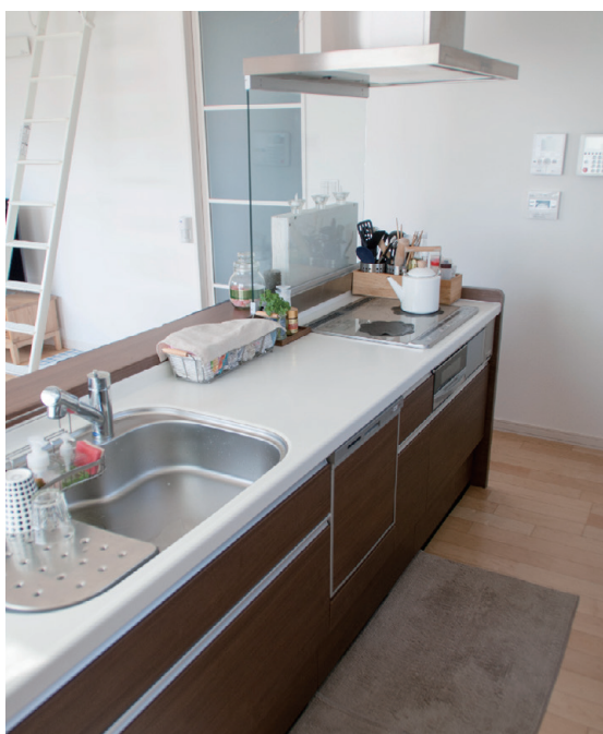
キッチン、食卓カウンター付きの対面式アイランド

ご家族の主たる生活の場は2階になります。LDKと寝室、水廻りがワンフロアにレイアウトされています。LDKは、他の家ではなかなか真似できない特徴があります。それは、信貴の美しい山並みが東の窓一面に広がるということ。あえて窓を少し高めの位置に設置することで、景色の美しい部分だけを切り取っているのがポイントです。そして、このことがプライバシーを確保しながら開放感の中に程よい落ち着きも生んでいるのです。部屋全体に目を向けると、ロフトを備えた勾配天井が変化を与え、ちょうど良い開放感が生活空間を包んでいました。ご家族のワンちゃんにとっても、とても心地良さそうに映りました。