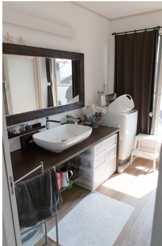
カジュアルでおしゃれな洗面カウンター

菜園を有する広い敷地に、長年育んだご夫婦の夢が形となったS様邸。しかし、それは野菜に例えるならまだ植えられたばかり。これからさらにご夫婦の夢は大きく育ち実を結んでいくことだと思います。