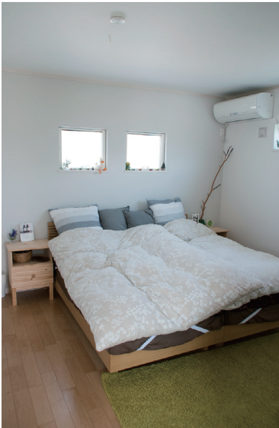
ナチュラル感あふれる寝室