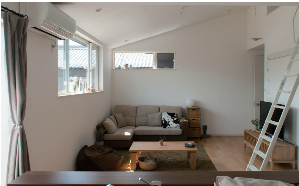
ロフトが一体となった、ちょうど良い広さと開放感のLDK

玄関から中にお邪魔すると、まず驚かされるのがそのおしゃれな雰囲気。ポーチから玄関のたたきに通じる床タイルや壁の装飾、置物など、その一つひとつにこだわりが感じられ、また全体としてモダンなカントリーテイストにコーディネートされています。S様邸は家中にこうしたナチュラル雑貨がセンスよく飾られています、それもそのはず、奥様の妹様が雑貨屋さんを営まれているらしいのです。奥様のセンスと妹様のプロのお見立てで家中がスタイリングされているというわけです。