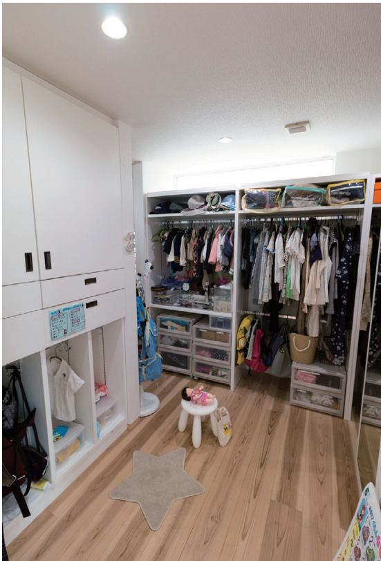
1階で衣類の収納と着替えができるファミリークローゼット