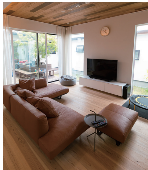
中庭との一体感が心地よいリビングルーム