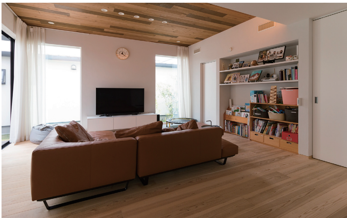
床には杉の無垢材、壁には珪藻土、天井にも木を施した自然素材のリビング空間 奥の白い引戸の向こうは“おもちゃ部屋”