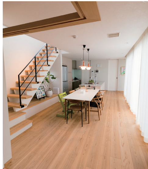
1階全体が見渡せるキッチン 階段はオリジナル設計

また、ファミリークローゼットにはお子さま専用の収納家具も据え付けられています。ここに勉強道具も仕舞い、お子さまたちは毎朝自分で身支度をして学校に行くのだそうです。これを見て、住みながらしてお子さまをまっすぐ育てる工夫が奥様のノートにたくさん詰まっていたことがわかりました。