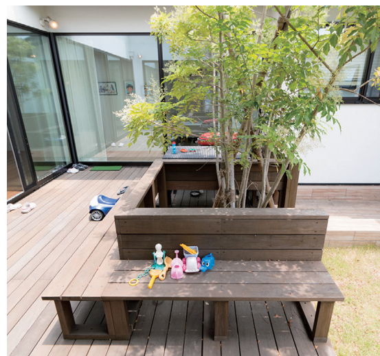
中庭が生活空間を隔て、各部屋に光と風、緑を届ける設計