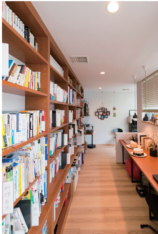
ご主人の趣味である本を壁一面にしまえる夫婦の書斎