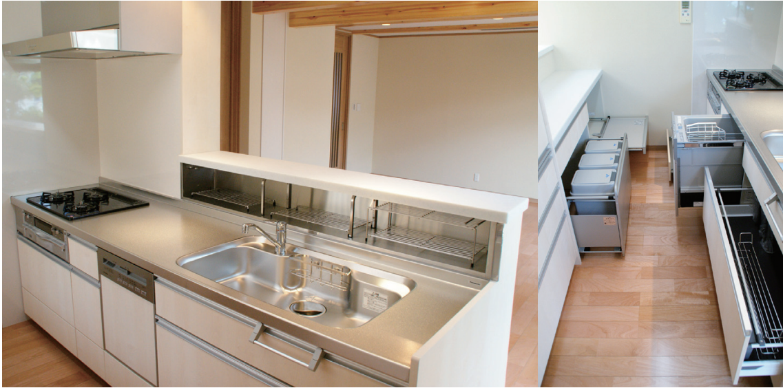
水切り棚が設けられた便利なキッチン。使いやすいスライド収納も充実。