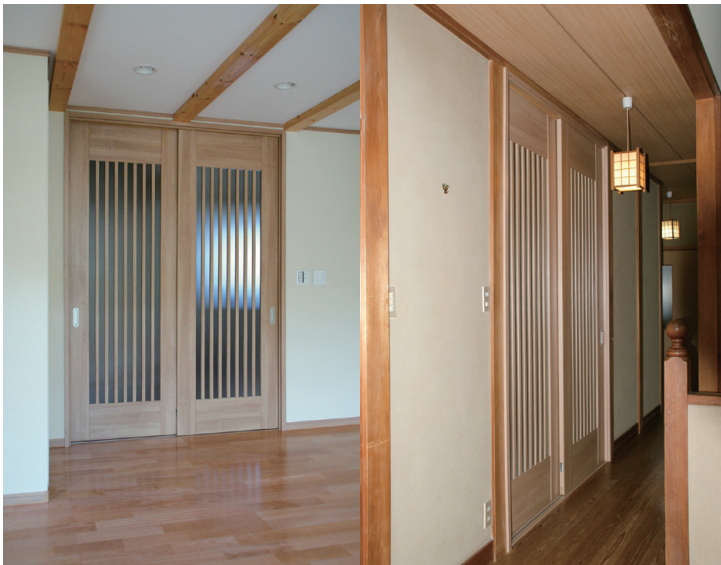
縦格子が美しい新和風スタイルの室内建具。廊下側の和風空間にも調和。