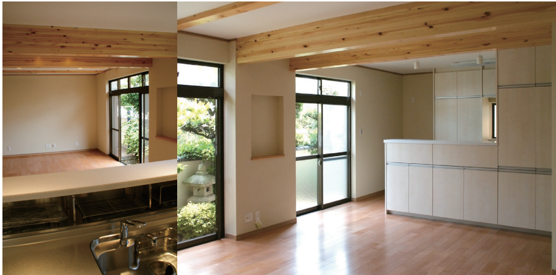
庭の緑が目に入る開放的な空間。対面キッチンの向かいの壁には大画面TVを設置予定。