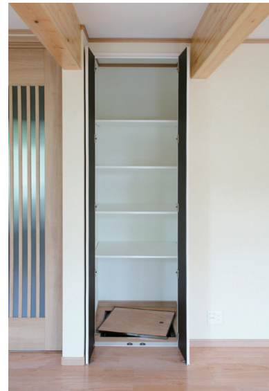
ダイニングスペースには、高さ・奥行きがたっぷりある収納庫を装備。