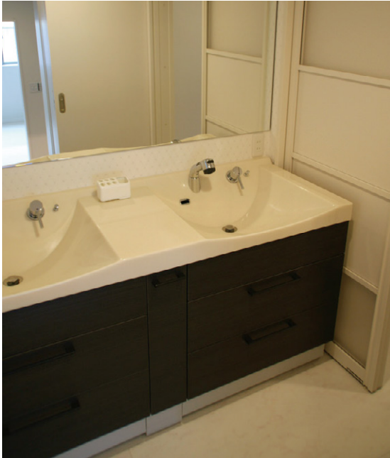
洗面室にはツインボールの化粧台を採用。