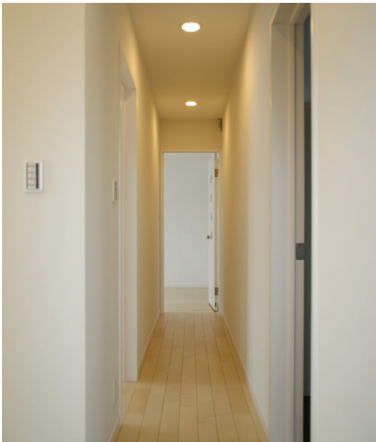
3階はナチュラルな木質床材で明るいイメージを演出。