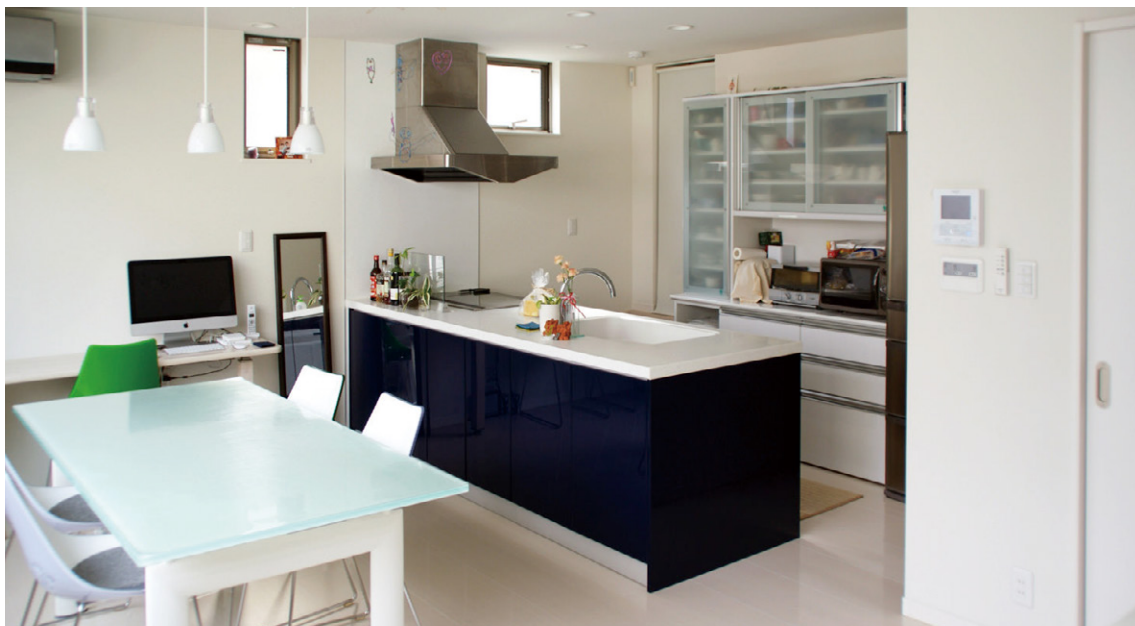
白い空間にダークブルー扉のキッチンが映えるLDK。家具もモダンなイメージで統一。

ご家族のご要望をカタチにしたもう一つの特徴的な例が、ツインボールの洗面化粧台と洗面室から独立した脱衣室です。年頃のお嬢様が2人いらっしゃるご家族ならではのニーズでしたが、冒頭に説明した既存の建物の上に持ち出す形状の設計にした結果、ゆとりの水回りスペースが実現しました。