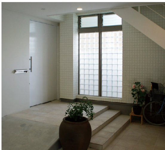
1階ガレージ横のアプローチ。既存棟の玄関(左)と増築棟の玄関につながる階段(右)とに分かれる。

1階の道路に面した玄関ドアを開けると家の中かと思いきや、そこはガレージの一角で階段の昇り口がありました。そう、そこはまだアプローチなのです。壁面のガラスブロックから光が入る階段を上ると、今度は正真正銘の玄関が出迎えてくれました。この玄関には向かって右手に間接照明で演出された大型玄関収納があり、正面には空間を広く見せるミラー扉の収納スペースも設けられています。これらの収納量の多さはご家族の満足されているポイントの一つだということです。