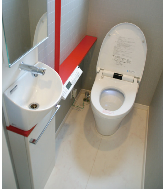
3階のトイレは赤がアクセント。