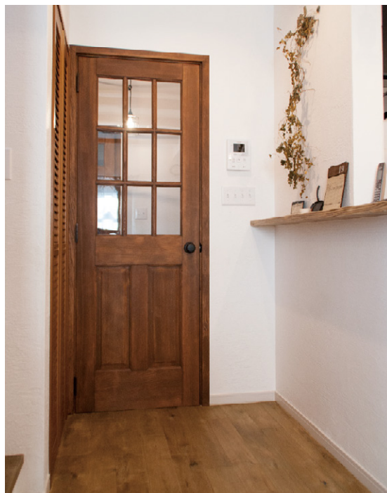
ドアは輸入物の無垢製をオイル塗装仕上げ

LDKには、この家のある意味主役であるTRUCKのソファが置かれています。それは一際目立つわけではありませんが、統一された世界観の中でさりげなく存在感を放っていました。そのルーズな雰囲気と質感は独特のものがああり、この一台の家具が暮らしをシンプルなスタイルに決めてしまうような強い個性を感じました。