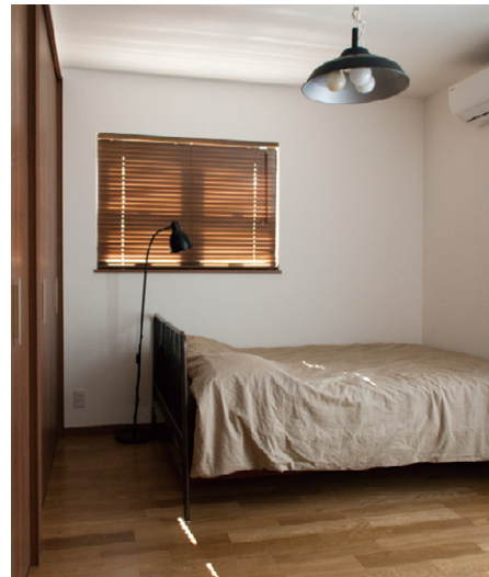
渋い印象の主寝室