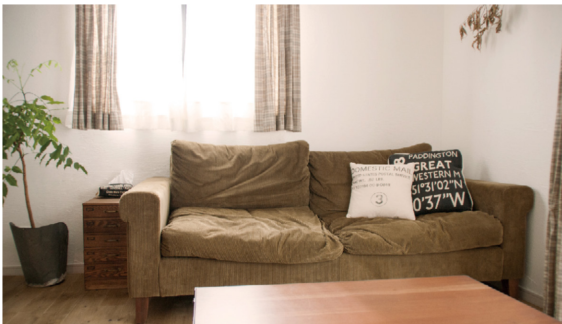
ビンテージ感覚でルーズな印象の「TRUCK」のソファ

LDKには、この家のある意味主役であるTRUCKのソファが置かれています。それは一際目立つわけではありませんが、統一された世界観の中でさりげなく存在感を放っていました。そのルーズな雰囲気と質感は独特のものがああり、この一台の家具が暮らしをシンプルなスタイルに決めてしまうような強い個性を感じました。