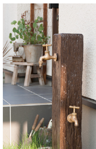
使い込んだイメージを演出