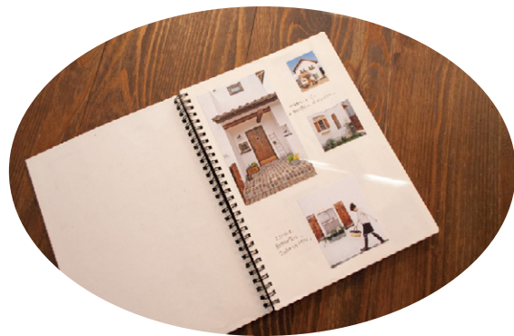
思い描いたイメージを1冊のノートに書き溜めて、一つひとつ実現されました