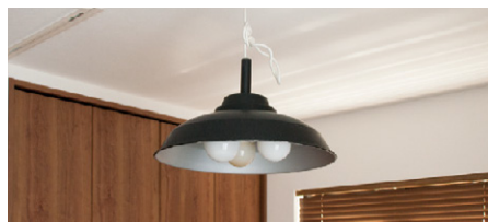
ランプシェードは、奥様自ら黒に塗装

最後に奥様は、「元々外にあまり出て行かない方なのに、この家に住んでよりインドア派になりました」と話されていました。お気に入りのインテリアに囲まれて、これからもずっと楽しい気分で過ごしていただければと思います。