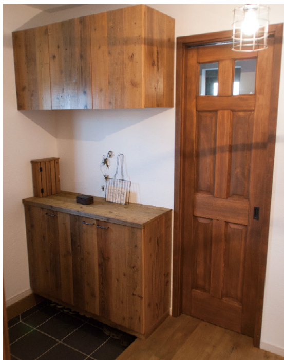
既製品に古材を貼付けた玄関収納

外観は一見するとシンプルな2階建てですが、道に面した上げ下げ窓にはあたかも板戸の開き窓のような装飾を施し、ガーデニングもビンテージ風の小物を置くなど、よく見るとこだわりの演出が施されています。家の中にお邪魔すると、さらに面白いこだわりの工夫を見つけました。珍しいビンテージ風の玄関収納が設置されていると思いきや、それは既製品の表面に古材を張って作り込んでいるのです。このように、O様邸では自然素材を用いたDIY的な味が魅力となって随所にちりばめられています。それこそが、TRUCKに通ずる世界観。そのトーンで、ならの無垢フローリングや輸入物の木製ドア、足場板を利用したカウンター、置き家具などが選ばれ見事にコーディネートされていました。そんなインテリアに対する興味とセンスをお持ちの奥様ですが、自ら雑貨を手づくりするという趣味もお持ちです。玄関に入って正面には、アンティークな室内窓で中が見える小部屋がありますが、ここは将来奥様お手製の雑貨などを置くショップにする予定だということです。