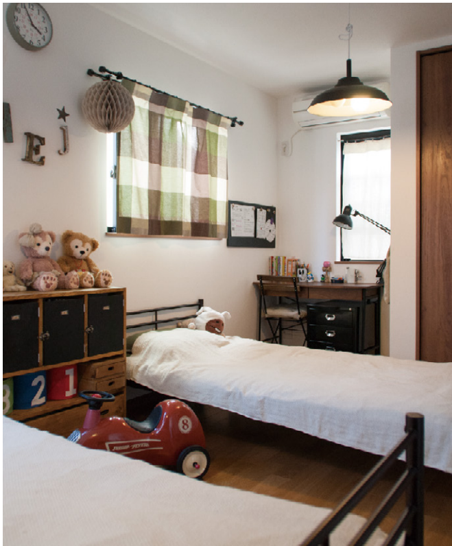
まるでインテリアショールーム! お子様が使っているのがウソのよう