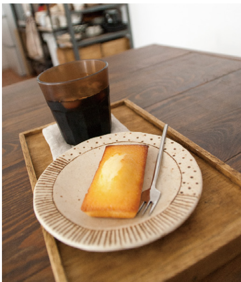
お出しいただいたお茶とお菓子を載せたプレートは、奥様のお手製の品

最後に奥様は、「元々外にあまり出て行かない方なのに、この家に住んでよりインドア派になりました」と話されていました。お気に入りのインテリアに囲まれて、これからもずっと楽しい気分で過ごしていただければと思います。